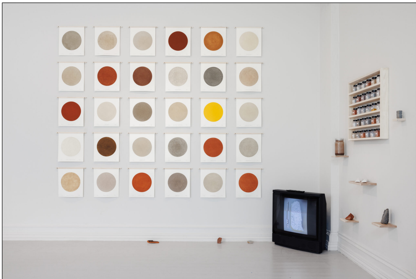
↑ Thomas Iversens artige «Byens flass» (2023), er en samling av materialbiter fra Oslos mange bygg, som er brutt ned og gjort om til trykkfarge og en serie trykk.

Dessverre går den flate strukturen på bekostning av kurateringen og visjonen i Momentumbiennalen, skriver Subjekts anmelder.