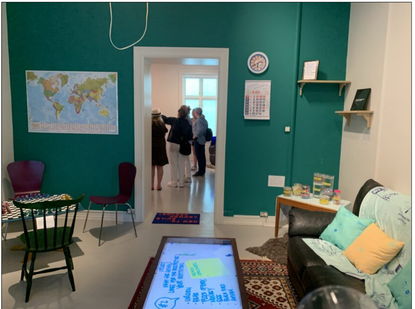
I «Gudhaus» (2023) presenteres samarbeidet mellom kollektivene Tenthause og Gudskul i en slags stue for erfaringer og lærdommer.