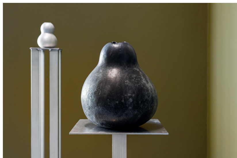
GRESSKAR: Disse blobbete voksskulpturene er modellert etter en type flaskegresskar som i Vest-Afrika brukes til krukker og instrumenter.