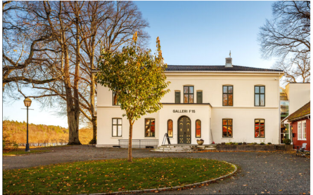
Galleri F 15 holder til på historiske Alby gård på Jeløy i Moss. Galleriet huser også biennalen Momentum.