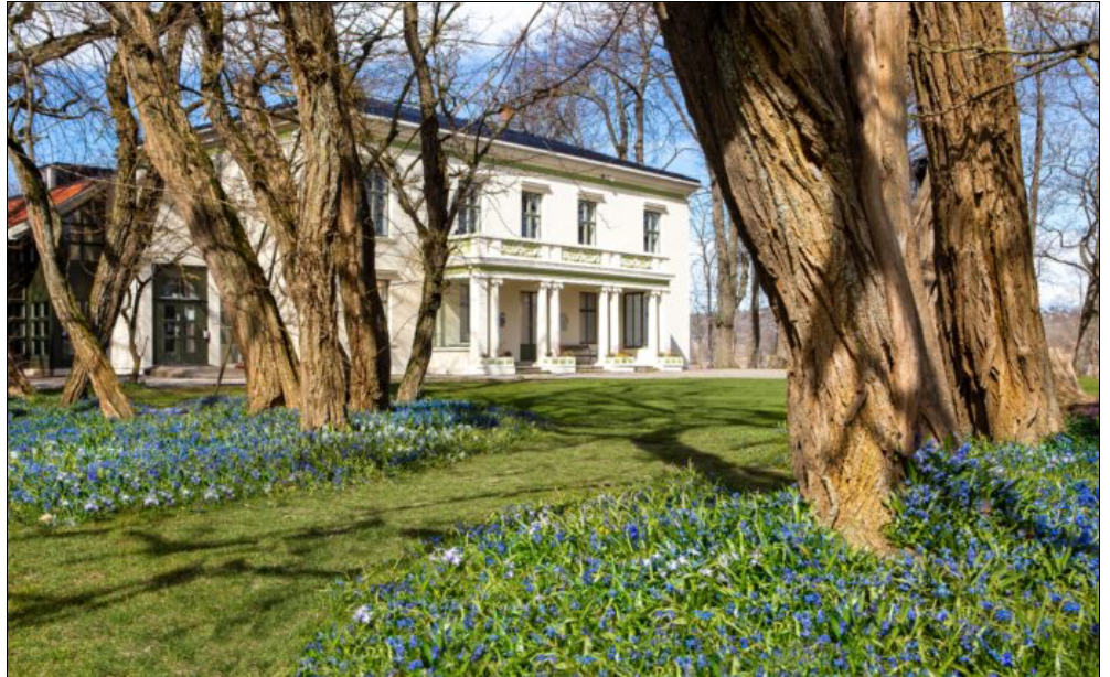
Galleri F 15 og festivalen Momentum holder til på Jeløy utenfor Moss.

Les også: En biennale uten momentum ser seg nødt til å proklamere følelser